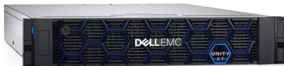
Dell EMC Unity XT 混合存储产品介绍