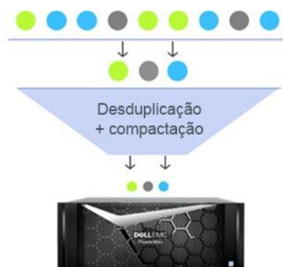
Deduplicação em linha e compactação do PowerMax

O PowerMax oferece eficiência extrema com deduplicação em linha e compactação, garantindo a redução de dados de até 5:1 (média de 3:1), snapshots com uso eficiente de espaço e provisionamento thin. A deduplicação em linha e a compactação com praticamente nenhum impacto sobre o desempenho podem ser usadas com todos os serviços de dados e são ativadas/desativadas por aplicativo.