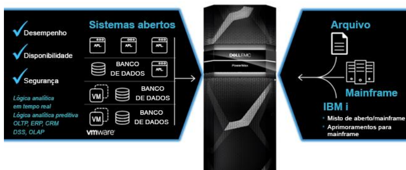
Consolidação em grande escala

O PowerMax possibilita a consolidação massiva com suporte a ambientes mistos: aplicativos de sistemas abertos, mainframe, IBM i e armazenamento de arquivos no mesmo array — simplificando as operações e reduzindo significativamente o TCO.