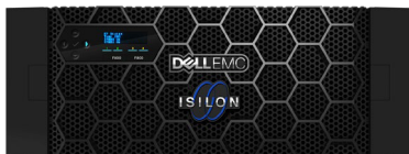
Dell EMC Isilon A200