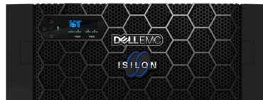
Dell EMC Isilon F810