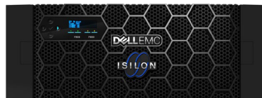
Dell EMC Isilon A2000