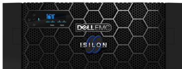
Dell EMC Isilon F800

Эти аппаратные платформы позволяют консолидировать и поддерживать широкий спектр файловых рабочих нагрузок. За счет модульной архитектуры высокой плотности с четырьмя узлами в одном корпусе формфактора 4U системы Isilon позволяют организациям сократить требования к пространству центра обработки данных и связанные издержки на 75%. Платформы прозрачно интегрируются с существующими кластерами или могут быть развернуты в новых кластерах.