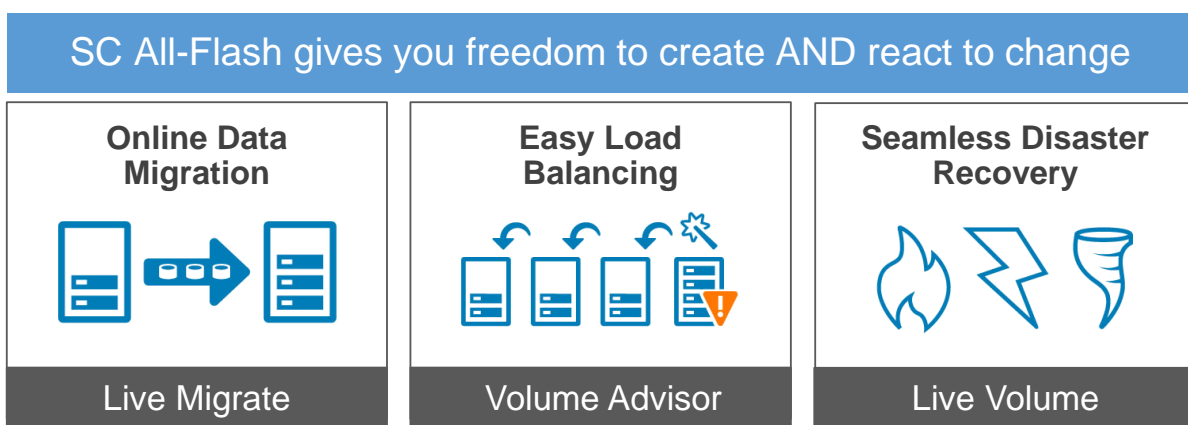
Рис. 1. Быстрое изменение конфигураций системы хранения без воздействия на рабочие нагрузки. Объединенная архитектура со встроенной функцией автоматического переключения при отказе делает SC класса All-Flash оптимальным решением, которое будет предоставлять стабильные преимущества в условиях изменчивых бизнес-сред.

Встроенный компонент Live Volume также поддерживает обработку рабочих нагрузок во время непредвиденных простоев и аварий. Бесперебойное автоматическое переключение при отказе между полностью синхронизированными томами в локальных и удаленных массивах обеспечивает защиту важных бизнес-операций без дополнительного оборудования и ПО. Live Volume поможет вам получить нулевые показатели целевого времени и целевой точки восстановления. Кроме того, вы сможете автоматически исправлять ошибки в своей среде высокой доступности после возобновления работы отказавшего массива.