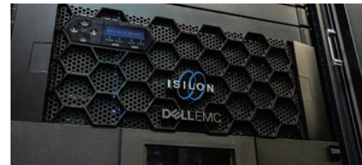
サンジゲンのサーバールームに設置された Dell Precision 3930 ラック型 (上)、 Dell EMC Isilon H400 (下)