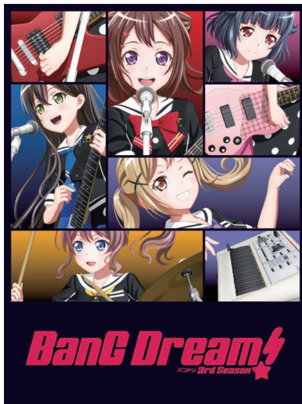
作品例/『BanG Dream! 3rd Season』

VDIだ。ただし、検証を重ねた結果、VDIを3DCGアニメーション制作の業務に適用するのは至難との結論に至ったという。VDIには相応の期待をかけていたのですが、3DCGやコンポジットのソフトウェアを動作させたところ、“映像と音声とのタイミングがズレる”“データの欠損を伴わないロスレスの圧縮ができない”など致命的な問題がいくつか見つかり、結局、活用を断念せざるをえませんでした(金田氏)。