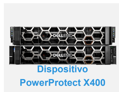
Dispositivo PowerProtect X400

PowerProtect X400 es un dispositivo multidimensional que puede escalar horizontalmente el procesamiento y la capacidad con aumentos lineales de rendimiento y capacidad mediante cubos X400F o X400H adicionales (a partir de 64 TB cada uno). Además, puede escalar de forma vertical con expansión de capacidad de crecimiento en el lugar (16 TB), por lo que es ideal para ambientes con un crecimiento de datos impredeciblemente alto.